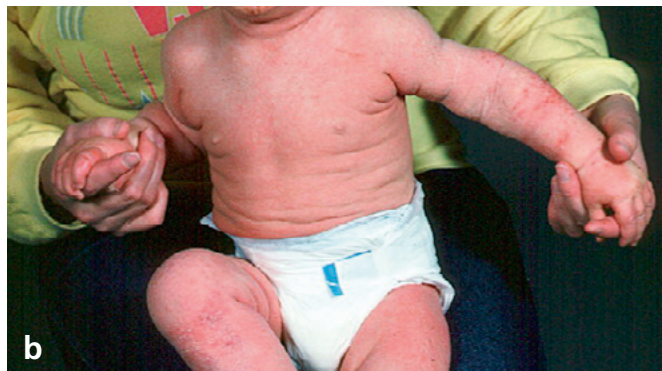
Foto 4: Nella scelta della terapia si dovrebbe distinguere tra la forma nummulare (a) e la forma generalizzata (b).

Per l'eczema atopico nella prima infanzia tuttavia, il principio «ungere, ungere, ungere» dovrebbe essere considerato in modo differente a seconda della morfologia, ha affermato Kernland-Lang.