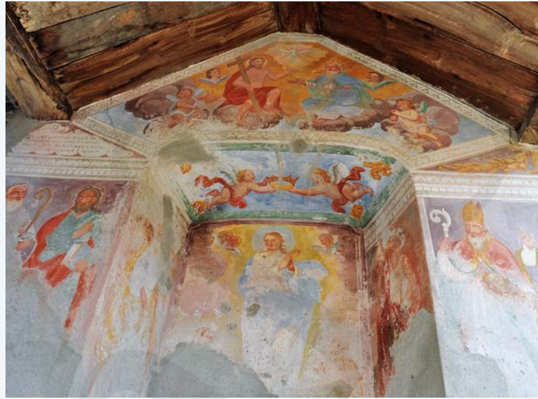
Abb. 3: Bilderreigen in einer der Kapellen zwischen Pila und Intragna

In dieser Rubrik werden Berg- und Schneeschuhwanderungen vorgestellt, die in der Regel wenig bekannt sind, zu aussergewöhnlichen Orten führen und die Genugtuung einer besonderen persönlichen Leistung bieten, sei es, dass man sich am Abend nach der Arbeit noch zu einer kleinen körperlichen Anstrengung überwindet, bzw. sich in ein oder zwei Tagen abseits breit getretener Wege unvergessliche Naturerlebnisse erschliesst. Zur besseren Beurteilbarkeit des Schwierigkeitsgrades der Tourenvorschläge wird jeweils eine Einschätzung anhand der SAC-Skala für Berg- (B, EB, BG) und für Schneeschuhwanderungen (WT 1–6) gegeben. Die schwierigste Wegstelle, unabhängig von ihrer Länge, bestimmt jeweils die Gesamtbewertung der Route. Letztendlich bleibt aber jeder selbst für die Beurteilung seiner Fähigkeiten und Eignung für die vorgestellte Wanderung verantwortlich. Die Gehzeiten sind Richtwerte und gelten für normal trainierte Wanderer. Sie müssen nicht zwingend mit den Angaben auf Wegweisern übereinstimmen.