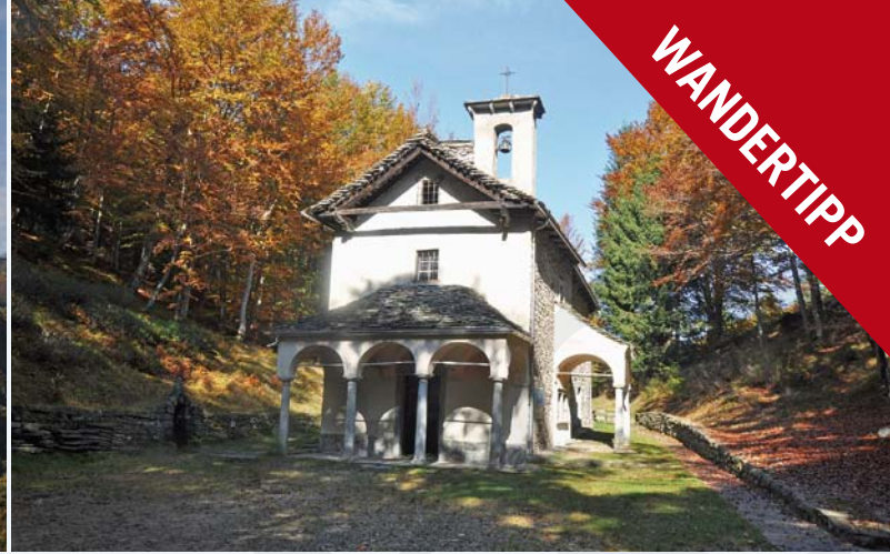
Abb. 2: Madonna della Segna