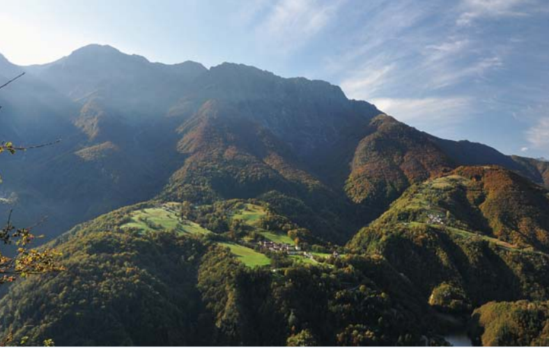
Abb. 1: Blick auf den Gridone mit den Dörfern Palagnedra und Moneto zu Füßen