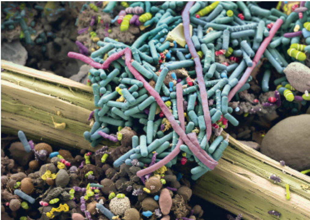
Abbildung 1: Diese handkolorierte Rasterelektronen-aufnahme vermittelt einen Eindruck von der Vielfalt des Mikrobioms im Darm. Im Zentrum ist eine unverdauliche Pflanzenfaser zu sehen, am rechten Bildrand (grosse hellbraune sphärische Struktur) eine Giardia-Zyste – kein normaler Bestandteil der Darmflora, diese Infektion war der Grund für die ärztliche Konsultation (Foto: © Martin Oeggerli, mit Unterstützung der Hochschule für Life Sciences, FHNW).